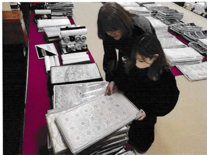
▲問屋さんで帯を吟味