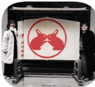
▶狛犬ならぬ狛うさぎ