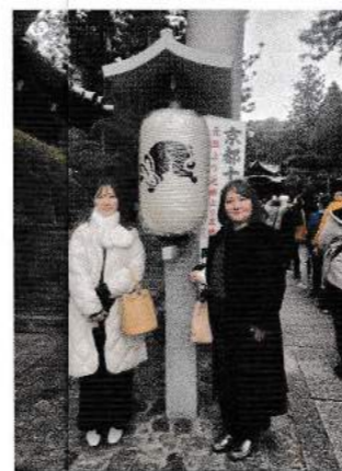
▲ち。うちんもうさぎ

~12年に1度の賑わいを見せる岡崎神社に行ってきました~ 御所からの卯の方角にあるから...昔境内にうさぎがいっぱい居たから... 様々ないわれがありますが、京都の住民問わず人気のある全国でも珍しいうさぎの神社