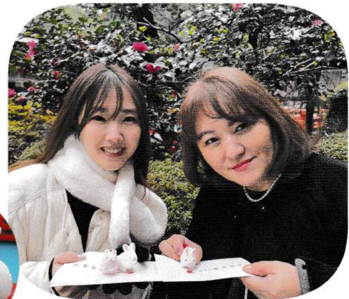
大勢の参拝客に交わって30個用意しました 先着30名にプレゼント!!