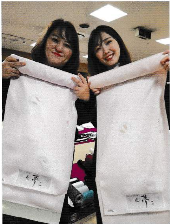
▶今年の干支うさぎ柄