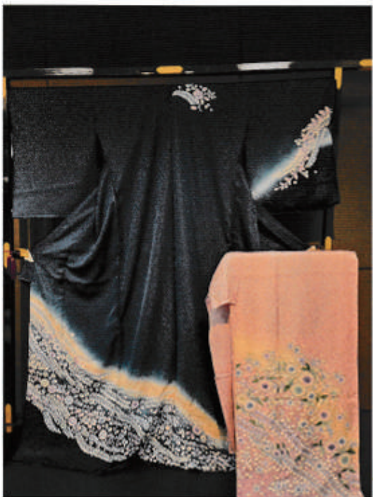
◆幻の染色「辻が花」風訪問着 通常¥230,000