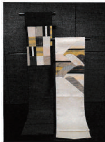
◆京都明星軒オリジナル「華織木」洒落袋帯 通常¥800,000