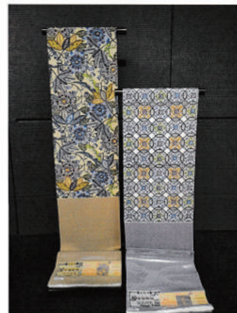
◆沖縄伝統工芸品「琉球本紅型」名古屋帯 通常¥780,000