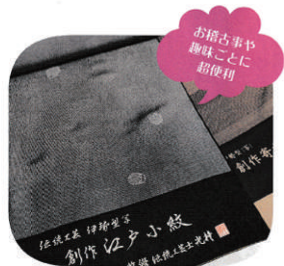
◆伊勢型写し創作「変わり江戸小紋」着尺 通常¥220,000