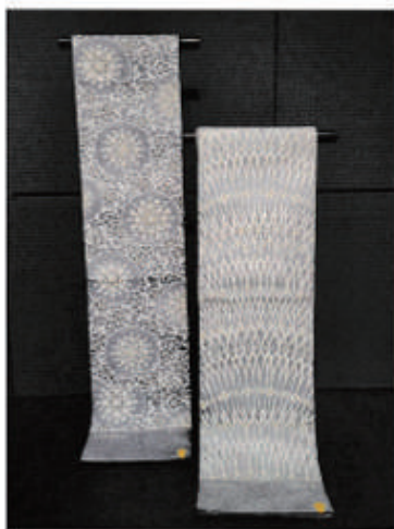
◆京都西陣の老舗「帯のまいづる」袋帯 通常¥280,000