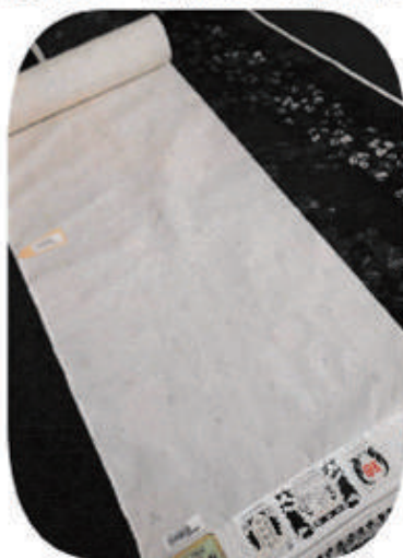
◆茨城伝統工芸品「結城軸80亀甲」袖着尺 通常¥398,000