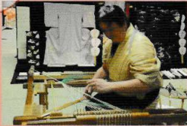
小物のコーディネートにこの機会に是非ご相談ください。

きものファンの憧れの逸品。名匠「平田組紐」謹製の江戸組紐帯締めをご紹介します。二大江戸組紐の五嶋紐と並び、有名百貨店でも取り扱われている商品です。上質の日本産絹糸を使って一本一本手組み作り上げられた「平田組紐」の帯締め。日本国内で熟練した職人が制作を行っており、その完成までには多くの人の手を通りかなりの時間を要しています。また素材にもこだわり、使う絹糸は国産の物のみです。